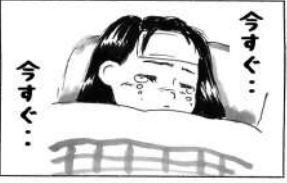
ゆっくりおやすみ C子

会えることができ、貴重な経験をさせて頂きました。そして、一番印象に残っている言葉があります。それは「今日一日」です。その言葉は自分自身の生活にも活かせる言葉だと思ひ、胸に秘めながら生活をするようになりまし。これまで、ご協力いただいた皆様ありがとうございました。これからもよろしくお願ひいたします。