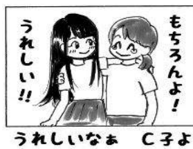
うれしいなよ C子よ