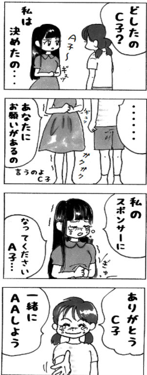
泣いちゃうよ C子A子