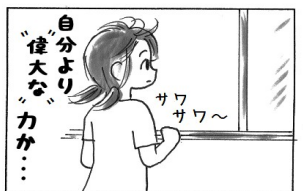
C子を見守ってね、A子

相馬を始めるのはね、（ミーティングを）あるNPOの職員さんに南相馬を始めるときに、挨拶に行っただけです。その時に、相馬から南相馬まで行くのは大変だけど、かなり問題を抱えている患者さんが多いので、できれば相馬でもやって欲しいという話があったんですよ。